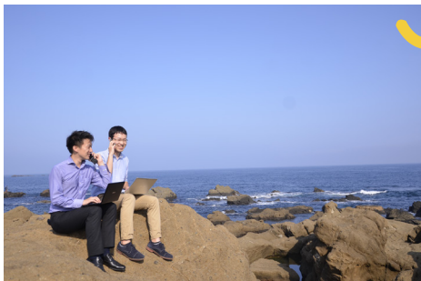
房総半島の先っちょで仕事中