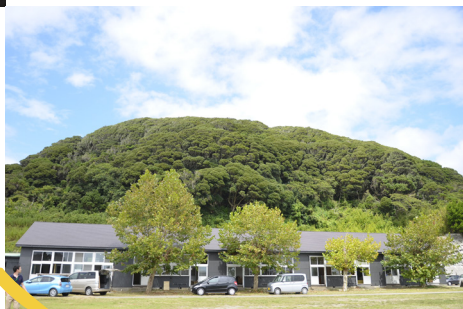
シラハマ校舎と裏山